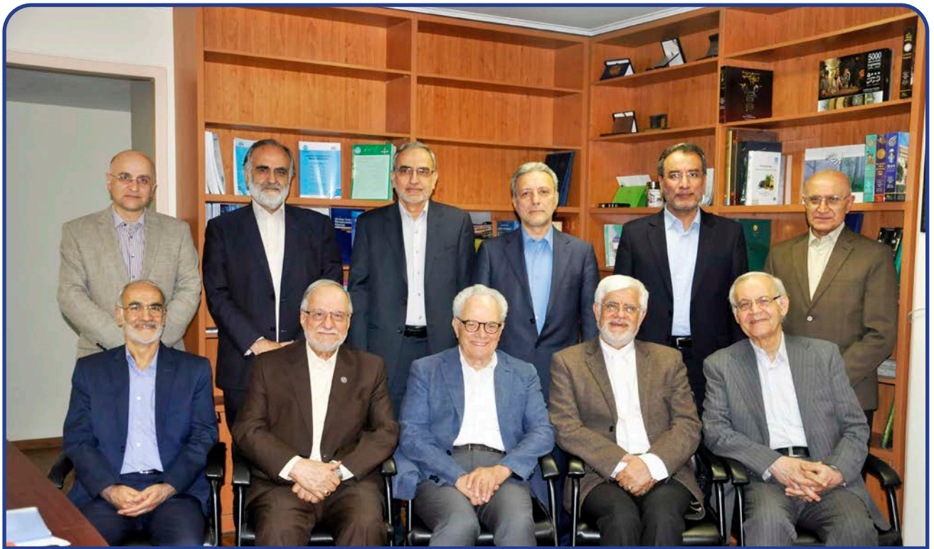
اعضای هیات امنای بنیاد، حاضر در جلسه ۹۸/۳/۲۵

به گزارش دبیرخانه بنیاد، در این جلسه که به ریاست دکتر محمدرضا عارف رئیس هیات امنای بنیاد تشکیل شد، پس از ارایه گزارش سالیانه مدیرعامل بنیاد، عملکرد هیات مدیره بنیاد در سال ۹۷ بر اساس برنامه مصوب مورد بررسی