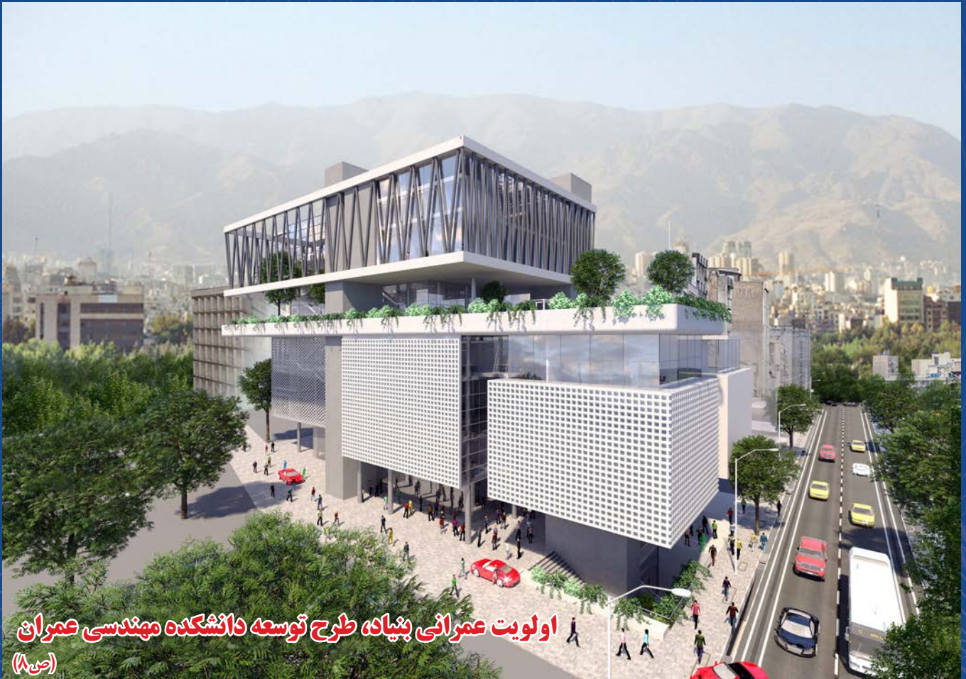
اولویت عمرانی بنیاد، طرح توسعه دانشکده مهندسی عمران (ص ۸)